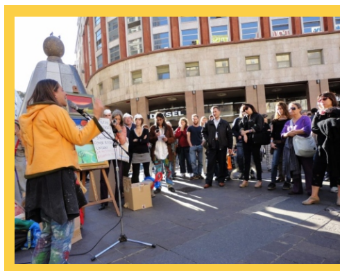
Militants Mad Pride se sont réunis à Piazza San Babila, Milan La pancarte dit: «I vaut mieux être fou que d'être un trou du cul»

Pour la première fois, Mad Pride a été organisé en Italie grâce à l'initiative de l'association Il cappellaio matto (Chapelier Fou). Un « sit in » a été organisé à la Piazza San Babila, l'une des places centrales de Milan. Des militants d'une dizaine de villes à travers l'Italie se sont déplacés pour l'occasion et des informations ont été distribuées au grand public. Côté symbolique, une quarantaine de participants ont porté des masques blancs et les ont ôtés pour les offrir aux passants. Une pièce de théâtre conçue spécialement pour l'occasion, et une table ronde à La Casa della Cultura ont été organisées en présence d'un élu de la ville et avec l'intervention de plusieurs usagers-survivants, un avocat militant et un psychiatre qui ont partagé leurs expériences, leurs propositions et leurs critiques.